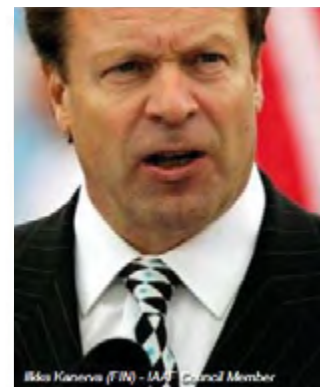
Ilkka Kanerva (FIN) - IAAF Council Member

Finnish President Mrs. Tarja Halonen, herself the recipient at the time of the 2005 World Championships of the IAAF's highest honour, the Golden Order of Merit, approved the list of proposed ministers today (19) in a ceremony held in the Finnish capital.