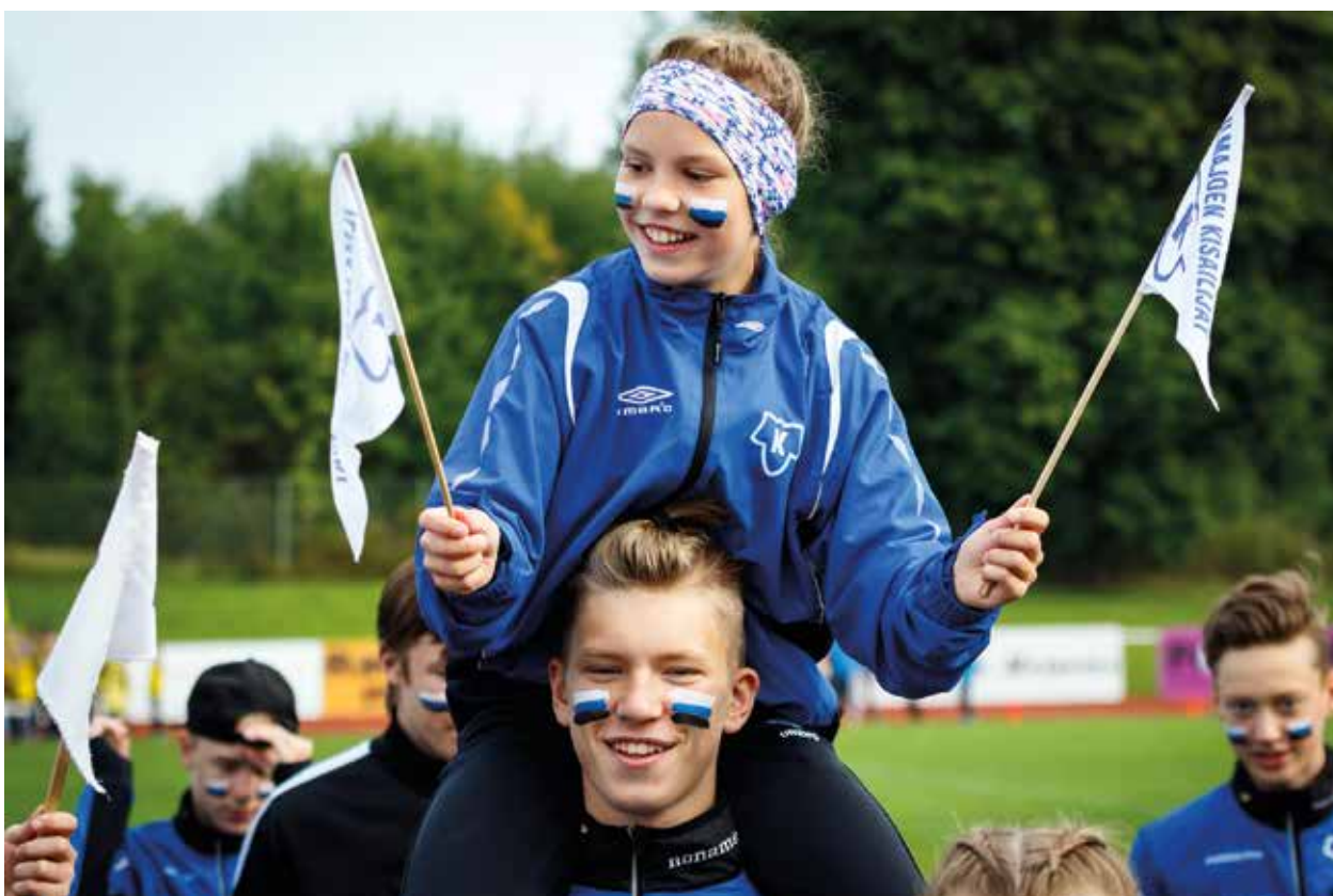
Ilmajoen Kisailijoiden nuoria iloisia yleisurheilijoita Seuracupin Giga-sarjan finaalissa 2017.

Yhteistyössä SUL:n Valmentajajyhdistyksen kanssa valmentajia ohjataan ja kannustetaan kansainvälisiin seminaareihin opiskelemaan ja verkostoitumaan. Seminaarien keskeisin anti on raportoitu Huippu-Urheilu-Uutisissa.