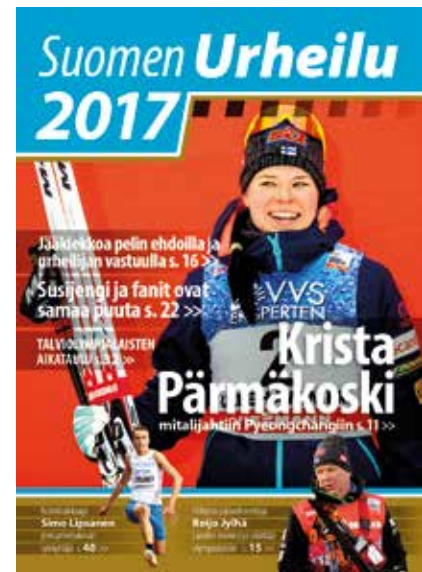
Suomen Urheilu 2017 -vuosikatsaus.

Seinäjoen Kalevan kisoissa järjestettiin Suomi 100-juhlaseminaari, jonka sisältö rakentui Martiskaisen kirjan teemoihin.